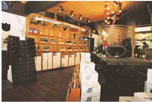
Weinverkauf in der Vinothek

Besuchen Sie uns in Durbach - Sie sind herzlich willkommen.