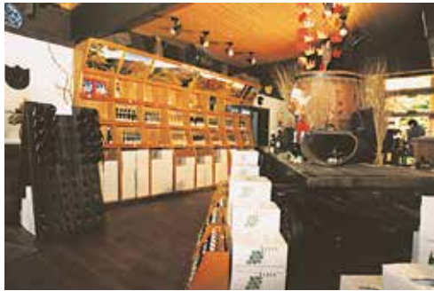
Weinverkauf in der Vinothek

Besuchen Sie uns in Durbach - Sie sind herzlich willkommen.